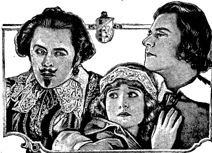
Theodore Kosloff, Betty Compson and Bert Lytell in the Paramount Picture "To Have and to Hold" A George Fitzmaurice Production

Najulubieńsi i najwybitniejsi artyści ekranu w rolach głównych: