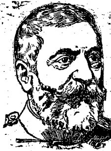
Radomir Putnik Wojewoda serbski.

Petersburg, 30 (P. A. T.) Komunikat urzędowy. Najwyższy Ukaz Imienny do senatu rządzącego. Uznając za konieczne postawienie na stopie wojennej części armii i floty, dla dokonania tego, zgodnie z Ukazami, które w dniu dzisiejszym My wydaliśmy ministrom: wojny i marynarki, rozkazujemy: