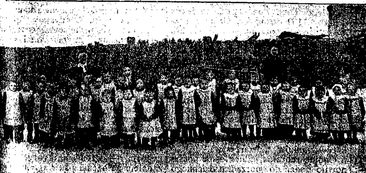
Dzieci wysyłane z Częstochowy na Kolonje Letnie