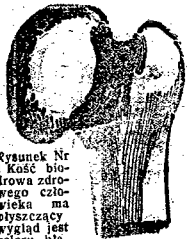
Rysunek Nr 1. Kość bio- rowa zdrowego czo- wieka ma wyszczupły wygląd i jest otwora bli- żniego niebieskawego. Patr. rys. Nr. 2.

PROSTY ŚRODEK REUMATYZM WE WSZYSKICH POSTACIACH WIAROWUJE SIĘ OBECNIE PUBLICZNOŚCI ZUPEŁNIE DAR- MO TYTUŁEM PRÓBY. WYLECZONO MNÓSTWO WYPADKÓW ZASTAŻALYCH OD 30 I NAWET 40 LAT.