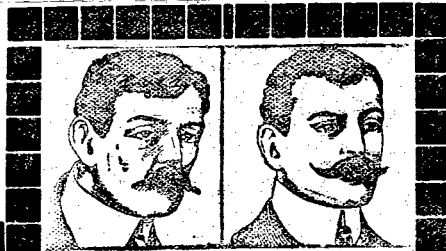
Przed użyciem. Po użyciu.