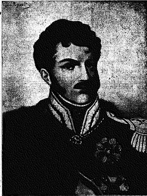
Książę Józef Poniatowski.

go i nacierają na rosjan pod Połonnem później pod Boruszkowcami i w końcu zwycięża pod Zielemcami odrzuca ich aż pod Dubienkę. Po krwawej walce pod Dubienką, otrzymał w szczyt niemieckich wiadomości od króla o przystąpieniu do Targowicy, opuszcza Ojczyznę i wyjeżdża na krótki czas do Wiednia.