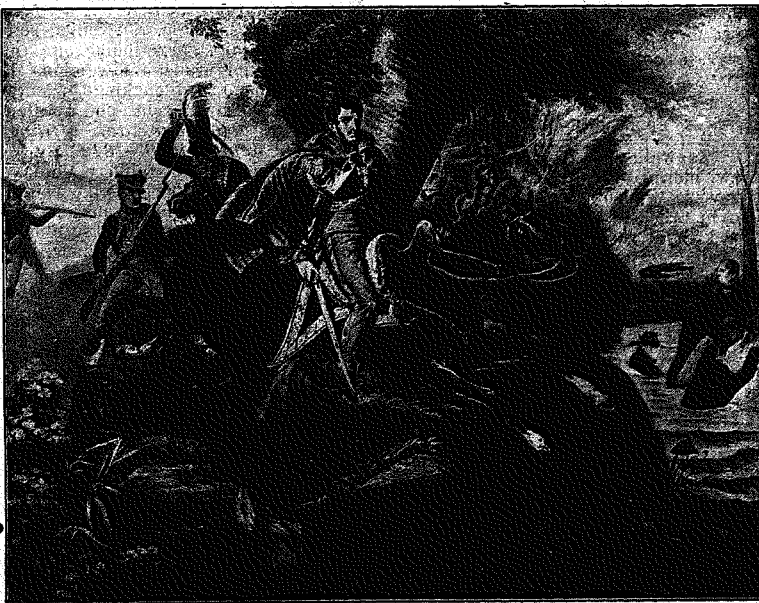
Ks. Józef pod Lipskiem.

Książę Józef, widząc straszny upadek Polski, spieszył do niej, ażeby walczyć w szeregach z zaparciem ducha, ażeby krew swoją przelać za Ojczyznę, nie bacząc na to, że idzie na śmierć niechybna. Kiedy ogłoszona została Konstytucja 3 Maja 1791 r. i wskutek niej wybuchła wojna z Rosją, nieustraszony wyrusza z 20-tysięczną, źle uzbrojoną armią przeciw 40-tysięcznej armii generała Kochowskiego.