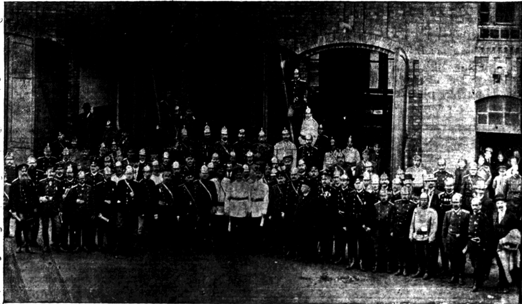
Naczelnicy Straży Ogniowych Ochotniczych w Królestwie Polskiem na Kursach Pożarniczych w Częstochowie w dn. 17 sierpnia 1913 r.

Cyfuje jasny pogląd na stosunki robotnicze w Łodzi, jaki ukazał się tu