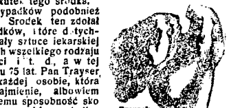
Rysunek Nr. 2. Wyrostek kości biodrowej w stanie chorobowym...