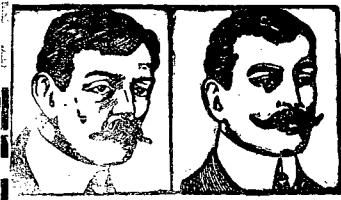
Przed użyciem. Po użyciu.

w Lombardzie Częstochowskiego Tow. Pożyczkowo - Oszczędn. odbędzie się dn. 14 Kwietnia r. b. od godz. 3-ej po południu w Sali Towarzystwa, ul. Teatralna № 11. Poczynając od dnia 1-go Kwietnia przy opłacie zaległych procentów doliczane będą kosz- ty licytacyjne w wysokości 2% od sumy otrzymanej pożyczki.