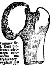
Rysunek Nr. 1. Kość biodrowa zstępująca ma blyszczyce wygięty jest białym niebieskawego. Patr.

PROSTY SRODEK LECZĄCY REUMATYZM WE WSZYSTKICH POSTACIACH OFIAROWUJE SIĘ OBECNIE PUBLICZNOŚCI ZUPEŁNIE DARMO TYTUŁEM PRÓBY. WYLECZONO MNOSTWO WYPADKÓW ZASTAŻALYCH OD 30 I NAWET 40 LAT.