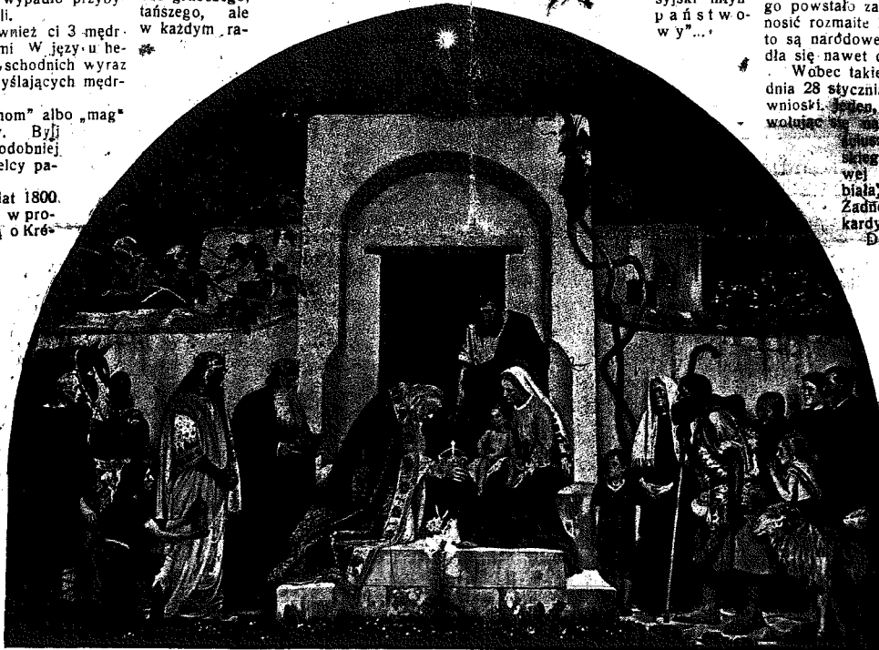
Hold Trzech Króli.