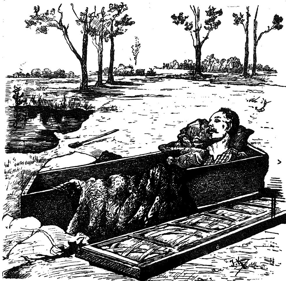
Tajemniczy trup w sofie.