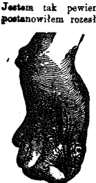
Wykazanie rąk przy chorobach reumatycznych i podagrze.