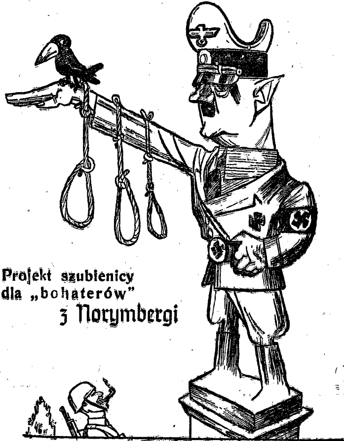
Projekt szubienicy dla „bohaterów” z Norymbergi

W zakończeniu swego artykułu autor omawia nadzieje, jakie Niemcy wiążą z perspektywą konfliktu anglosasko-sowieckiego. Nadzieje te określa jako marzenie o „zmniejszeniu następstw klęski dla Niemiec”. Sprowadzają się one do „odruczenia” zadań terytorialnych Polski i zwrótu Niemcom Prus Wschodnich, dalej opuszczenia terytorium niemieckiego przez mocarstwa okupacyjne, zmniejszenie do „znosnych rozmiarów” niemieckich świadczeń reparacyjnych, a w szczególności przyzwolenia z programu zniszczenia i wywiezienia niemieckich zakładów przemysłowych i zastąpienia go planem świadczeń rzeczowych przemysłu niemieckiego na konto odszkodowań wojennych. Autor kończy interesującym stwierdzeniem, że Niemcy wiążą swe nadzieje nie tylko pragnieniem wojny anglosasko-sowieckiej, lecz także liczą na rywalizację i walkę gospodarczą między Anglią a Stanami Zjednoczonymi.