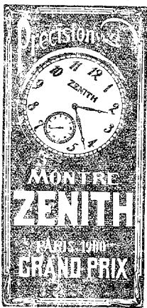
Wyłączna sprzedaż w składzie zegarków Jana Szefflera w Częstochowie.